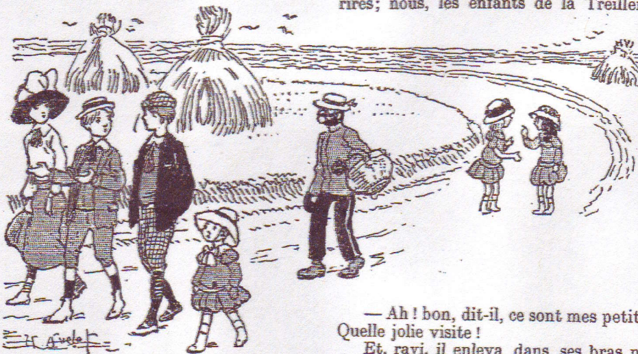
Marite et Mimi s'attardaient en longs bavardages.