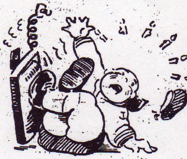
La petite fille était trop légère, le petit garçon était trop lourd.