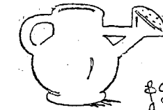
Le père Hibou congestionné, suant, fut rejoint par sa femme.

Le boy revint alors vers Odette et, pour la première fois, elle le vit rire franchement tandis qu'elle battait des mains gaiement. Comment troublersa joie? Elle remit son avertissement au lendemain. Le soir, le bourreau rentré, le boy montra la même répugnance à le suivre et ses cris