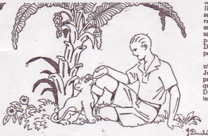
Un petit lion que j'avais élevé au biberon.

Le lendemain, en soupirant, Pouf arriva avec son bagage scolaire et son savoir. Celui-ci ne pesait pas lourd ! Didier la gronda un peu, mais sans raillerie, et elle accepta en silence ses reproches qu'elle reconnaissait mérites. Et puis elle résolut, pour faire plaisir au professeur improvisé, de se montrer bonne élève. Or, si elle avait été paresseuse jusqu'alors, elle était remarquablement intelli-