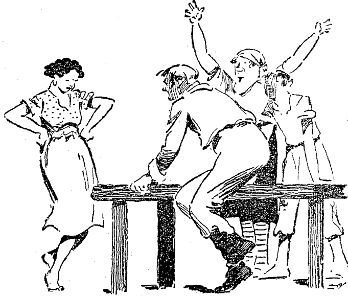
Le facteur scandait sa danse en tapant du pied.

Elisabeth n'osa pas répéter ce qu'elle avait entendu ; peut-être, d'ailleurs, Marie-Thérèse ignorait-elle que M. Ripka avait épousé Lisa ; il ne parlait presque jamais, on ne lui parlait pas davantage.